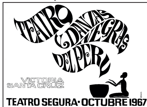
Figura 2: Símbolo gráfico de Teatro y Danzas Negras del Perú, realizado por Octavio Santa Cruz Urquieta para anunciar el estreno de la agrupación en 1967.

En ese contexto, vi reaparecer sobre las redes la fotografía 1, que da testimonio de una de las producciones de Victoria en