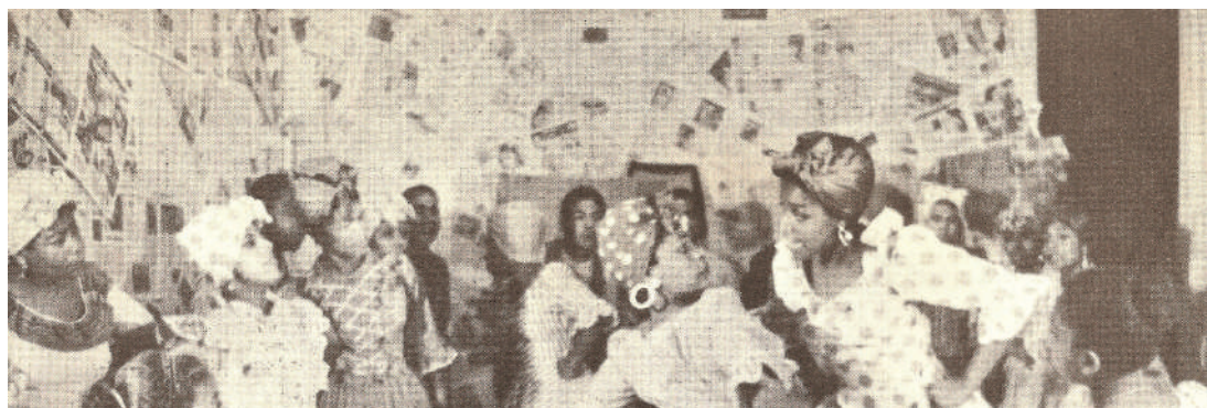
Figura 4: Cuadro teatral "Las Lavanderas", elenco de Teatro y Danzas Negras del Perú

Nótese también que en dicha foto aparecen accesorios del cuadro teatral "Compadre