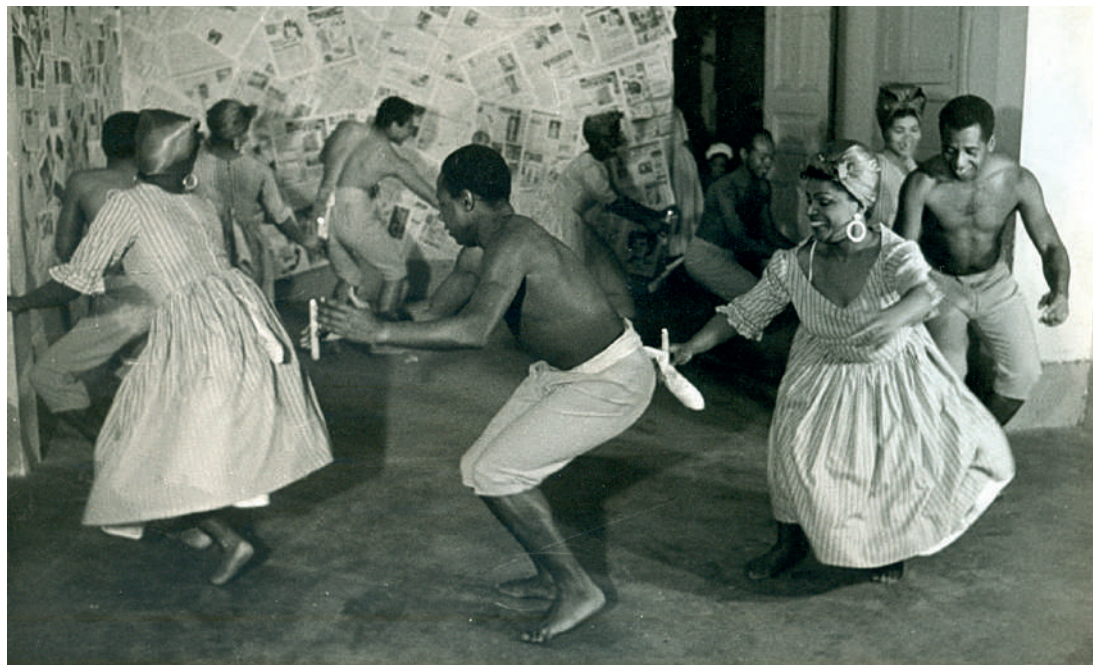
Figura 3: Alcatraz, elenco de Teatro y Danzas Negras del Perú

En tercer lugar, todos los miembros del grupo eran igual de importantes. Inclusive en las Figuras 3 y 4, que datan de los años 60, podemos