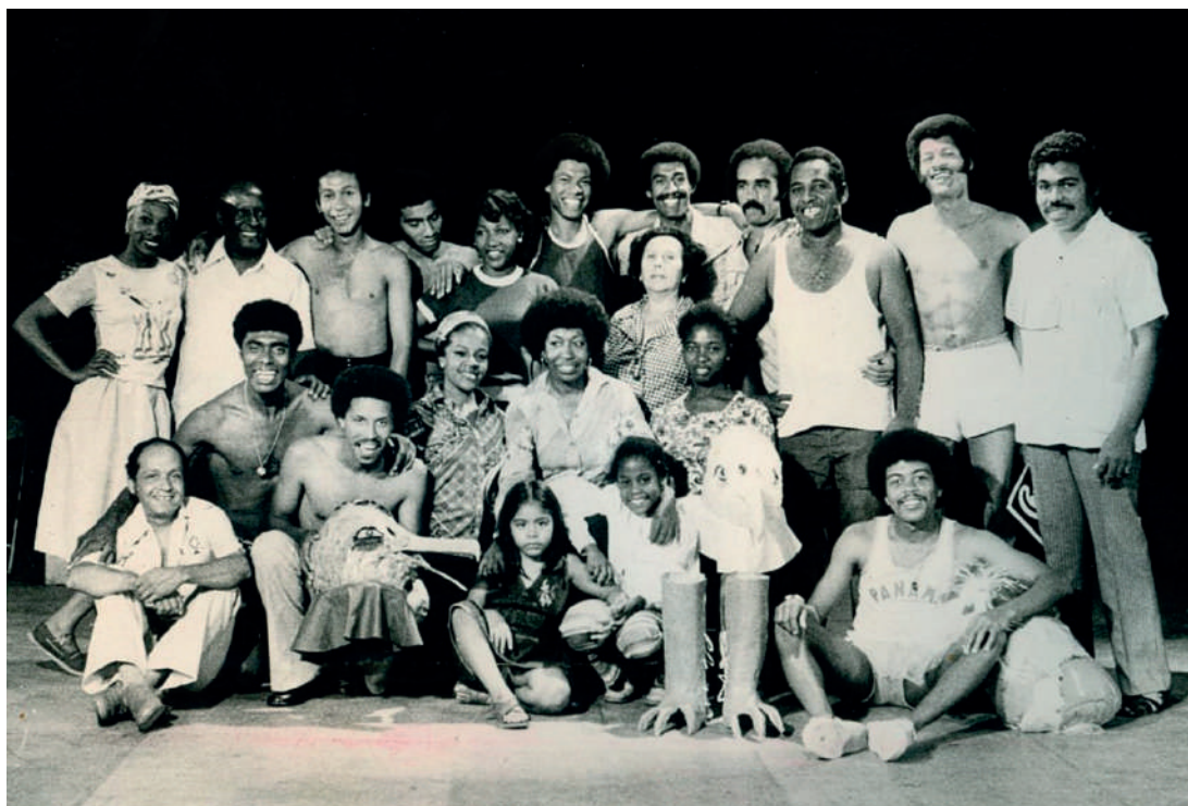
Figura 1: Victoria Santa Cruz con algunos integrantes de su compañía. Foto tomada durante uno de los ensayos previos al debut de la obra “Negro es mi color” en 1980.

and Woman”, realizado por el director teatral italiano Eugenio Barba, fundador de la Odin Teatret (Dinamarca), abocado a la antropología teatral. Esto evidencia claramente que, ya en ese entonces, Victoria tenía una imagen relevante a nivel internacional. Eugenio Barba llegó al Perú con el Odin Teatret para organizar un evento de alta relevancia que reunió en Ayacucho a gran parte de las personas vinculadas al ámbito teatral. Cuán trascendente fue este evento, que -al parecer- marcaría un hito vivificador que no corresponde explicar en estas páginas y deberá ser visto a la luz de un desarrollo histórico del teatro peruano. Aquí solo cabe mencionar que, a tal fin, Victoria participó en dicho encuentro dictando talleres prácticos sobre el ritmo, ya no dentro del núcleo cerrado de los integrantes de su propio elenco, sino, esta vez, para una participación bastante numerosa constituida por la gente de teatro. La segunda interpretación